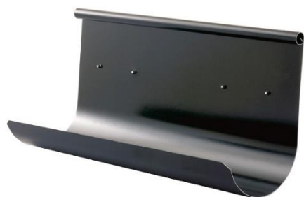
Överspolningskydd - Rak