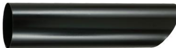
Påskjutsrör för renstratt