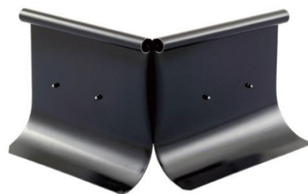
Överspolningskydd - Vinklad